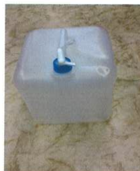
PHOTO DU PRODUIT/ PHOTO OF THE PRODUCT